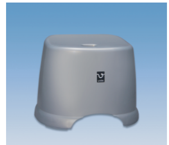
風呂椅子角／HK ●価格:1,850円 ●サイズ:366×280×288 ●入数:24 ●材質:ポリプロピレン POS/ [W]415564 [B]415571 [S]415588