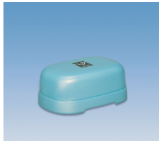
石鹸箱／E ●価格:280円 ●サイズ:106×79×46 ●入数:120 ●材質:ポリプロピレン POS/ [W]415410 [B]415427 [S]415434