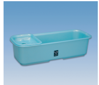
シャンプー台／C ●価格:750円 ●サイズ:320×125×83 ●入数:40 ●材質:ポリプロピレン POS/ [W]415502 [B]415519 [S]415526