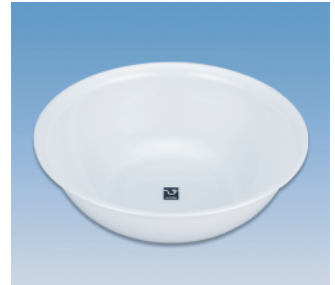
洗面器／S X ●価格:650円 ●サイズ:318φ×101 ●入数:60 ●材質:ポリプロピレン POS/ [W]421510 [B]421527 [S]421534