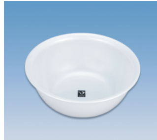
湯桶／S X ●価格:500円 ●サイズ:269φ×100 ●入数:60 ●材質:ポリプロピレン POS/ [W]421442 [B]421459 [S]421466