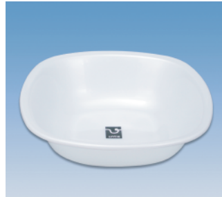
洗面器／角 ●価格:650円 ●サイズ:306×306×86 ●入数:60 ●材質:ポリプロピレン POS/ [W]415380 [B]415397 [S]415403