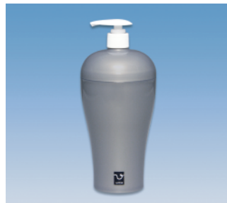
ディスペンサー／R ●価格:900円 ●サイズ:97φ×215 ●容量:600ml ●入数:30 ●材質:本体・フタ/ポリプロピレン POS/ [W]422531 [B]422548 [S]422555