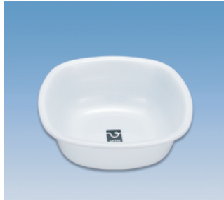
湯桶／角 ●価格:500円 ●サイズ:260×260×97 ●入数:60 ●材質:ポリプロピレン POS/ [W]415359 [B]415366 [S]415373