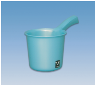
手桶／S ●価格:500円 ●サイズ:139φ×262×154 ●入数:20 ●材質:ポリプロピレン POS/ [W]415472 [B]415489 [S]415496