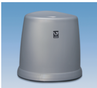
風呂椅子／HL ●価格:2,400円 ●サイズ:353×303×335 ●入数:16 ●材質:ポリプロピレン POS/ [W]417308 [B]417322 [S]417315