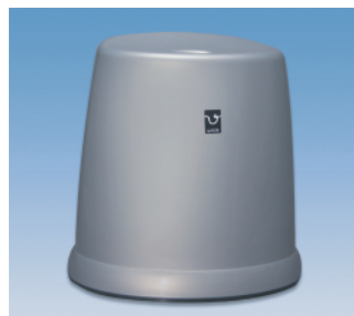
風呂椅子／High ●価格:4,800円 ●サイズ:394×335×395 ●入数:10 ●材質:ポリプロピレン POS/ [W]415694 [S]415700

●価格はすべて税抜き価格です ●共通バーコード番号 (4973473) ●サイズ表示 横×縦×高 (mm) ●ポンプファンクションで約2mlが噴出されます