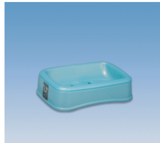
石鹸台／S ●価格:420円 ●サイズ:135×100×36 ●入数:100 ●材質:ポリプロピレン POS/ [W]415441 [B]415458 [S]415465