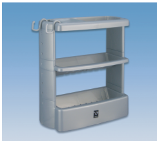
ボトルラック組立式 ●価格:1,850円 ●サイズ:318×148×340 ●入数:20 ●材質:ポリプロピレン POS/ [W]415595 [B]415601 [S]415618