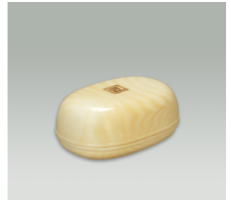
石鹸ケース RX ●価格:450円 ●入数:120 ●サイズ:120×83×50 ●材質:ポリプロピレン ●POS: 420339