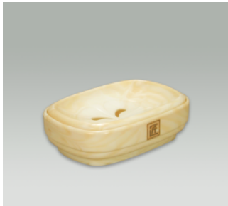
石鹸台 D ●価格:700円 ●入数:60 ●サイズ:150×104×45 ●材質:ポリプロピレン ●POS: 420346