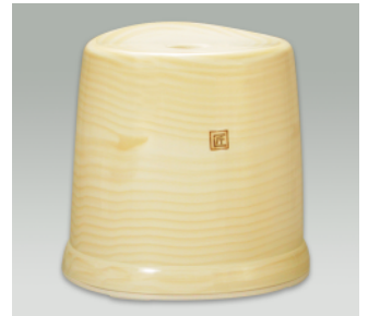
風呂椅子 HL ●価格:3,000円 ●入数:16 ●サイズ:353×303×335 ●材質:ポリプロピレン ●POS: 420377

●価格はすべて税抜き価格です。 ●共通バーコード番号 (4973473) ●サイズ表示 横×縦×高 (mm) ●カラーコード TK-WB