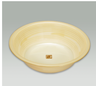
洗面器 A ●価格:1,500円 ●入数:30 ●サイズ:328φ×102 ●材質:ポリプロピレン ●POS: 420315