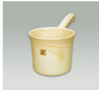
手桶 DX ●価格:850円 ●入数:60 ●サイズ:145φ×268×152 ●材質:ポリプロピレン ●POS: 420322