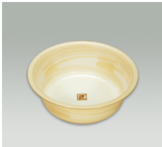
湯桶 A ●価格:1,000円 ●入数:40 ●サイズ:274φ×102 ●材質:ポリプロピレン ●POS: 420308