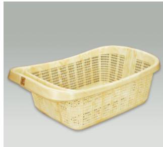
脱衣かご ●価格:2,000円 ●入数:20 ●サイズ:550×360×200 ●材質:ポリプロピレン ●POS: 420353