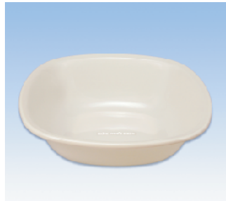
洗面器/角 ●価格:650円 ●サイズ:306×306×86 ●入数:60 ●材質:ポリプロピレン POS/ Gr 412594 Bk 412600 W 412617 Iv 412624