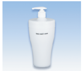
ディスペンサー/F ●価格:900円 ●サイズ:97φ×213 ●入数:30 ●材質:本体・フタ/ポリプロピレン ●容量:600ml POS/ Gr 422494 Bk 422500 W 422517 Iv 422524