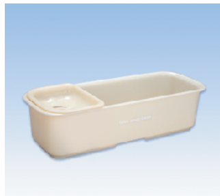
シャンプー台/C ●価格:750円 ●サイズ:320×125×83 ●入数:40 ●材質:ポリプロピレン POS/ Gr 412679 Bk 412686 W 412693 Iv 412709