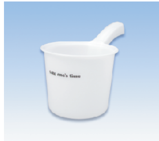
手桶/S ●価格:500円 ●サイズ:139φ×262×154 ●入数:60 ●材質:ポリプロピレン POS/ Gr 412631 Bk 412648 W 412655 Iv 412662