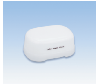
石鹸箱/E ●価格:280円 ●サイズ:106×79×46 ●入数:120 ●材質:ポリプロピレン POS/ Gr 412716 Bk 412723 W 412730 Iv 412747