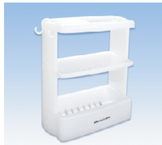
ボトルラック組立式 ●価格:1850円 ●サイズ:318×148×340 ●入数:20 ●材質:ポリプロピレン POS/ Gr 412877 Bk 412884 W 412891 Iv 412907