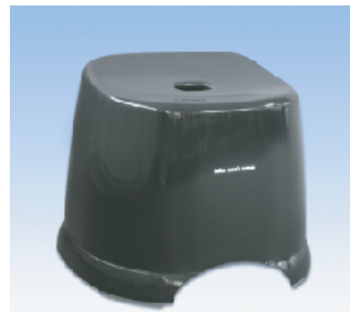
風呂椅子角/HK ●価格:1850円 ●サイズ:366×280×288 ●入数:24 ●材質:ポリプロピレン POS/ Gr 414741 Bk 414758 W 414765 Iv 414772