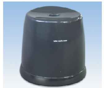
風呂椅子角/HL ●価格:2400円 ●サイズ:353×303×335 ●入数:16 ●材質:ポリプロピレン POS/ Gr 417285 Bk 417292 W 417261 Iv 417278