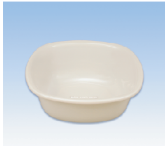
湯桶/角 ●価格:500円 ●サイズ:260×260×97 ●入数:60 ●材質:ポリプロピレン POS/ Gr 412556 Bk 412563 W 412570 Iv 412587

忙しい毎日だからこそ、静かでおだやかなひとときを。 そんな気持ちを満たしてくれる「take one's ease」シリーズ。 やさしいテイストでナチュラル&シンプルな暮らしを提案します