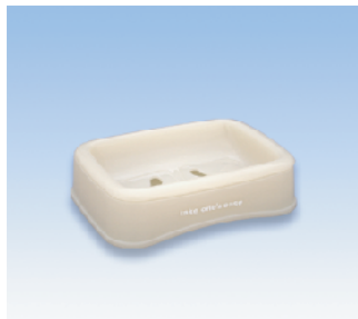
石鹸台/S ●価格:420円 ●サイズ:135×100×36 ●入数:100 ●材質:ポリプロピレン POS/ Gr 412754 Bk 412761 W 412778 Iv 412785