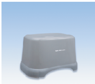
風呂椅子角/C ●価格:1250円 ●サイズ:310×225×190 ●入数:30 ●材質:ポリプロピレン POS/ Gr 412792 Bk 412808 W 412815 Iv 412822