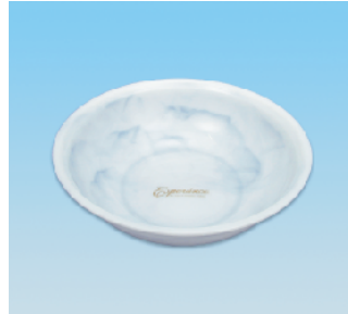
洗面器/EX ●価格:3,200円 ●サイズ:327φ×97 ●入数:30 ●材 質:ポリプロピレン POS/[G]564460 [Br]564477 [W]564484