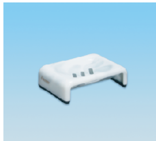
セッケンホルダー/EX ●価格:1,800円 ●サイズ:150×103×39 ●入数:40 ●材 質:ポリプロピレン POS/[G]566464 [Br]566471 [W]566488