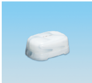
セッケンケース/EX ●価格:800円 ●サイズ:120×83×38 ●入数:90 ●材 質:ポリプロピレン POS/[G]575466 [Br]575473 [W]575480