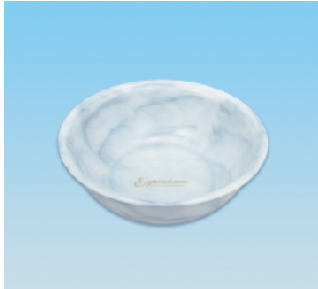
湯桶/EX ●価格:2,500円 ●サイズ:275φ×97 ●入数:30 ●材 質:ポリプロピレン POS/[G]563463 [Br]563470 [W]563487