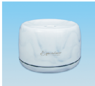
風呂椅子・丸/RX ●価格:5,000円 ●サイズ:330×280×227 ●入数:8 ●材 質:ポリプロピレン POS/[G]567461 [Br]567478 [W]567485