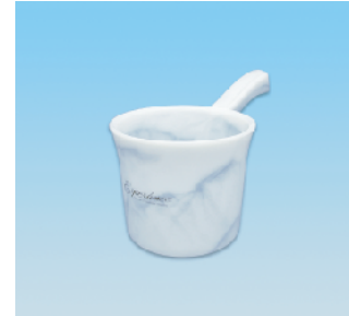
手桶/EX ●価格:2,300円 ●サイズ:145φ×270×148 ●入数:60 ●材 質:ポリプロピレン POS/[G]576463 [Br]576470 [W]576487