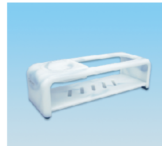
シャンプーデッキ/EX ●価格:3,500円 ●サイズ:366×140×110 ●入数:20 ●材 質:ポリプロピレン POS/[G]565467 [Br]565474 [W]565481